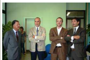
Foto: inaugurazione sportello PerMicro di Bergamo - 21/07/09

Leggi la rassegna stampa dell'evento di inaugurazione.