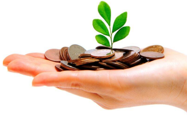
hand full of money and holding a green plant

La ricerca sull'impatto sociale economico e sociale dell'inclusione finanziaria ha analizzato anche un arco temporale che va dal 2009 al 2023.