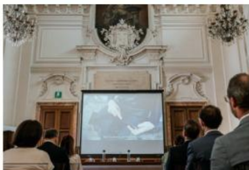
ni di euro in sussidi e 130 miliardi di entrate fiscali

N on è facile fare il bene. Papa Francesco nella meditazione del 14 marzo 2017, sul brano di Isaia 1, 10.16-20, ricordava che è un cammino che richiede «coraggio, per allontanarsi» dal male, e «umiltà per imparare». E che, soprattutto, ha bisogno di «cose concrete», non parole. Durante la presentazione dello studio sull'Im-