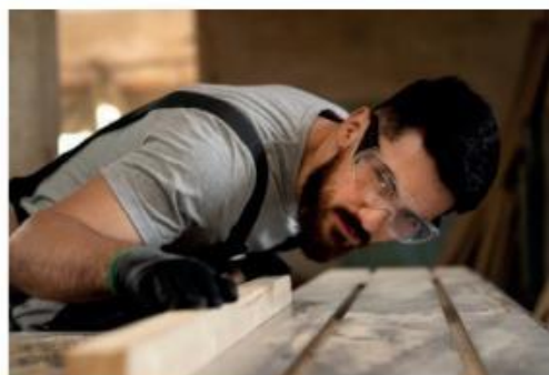
il miglior anno in termini di crescita, ma ciò che ci ran-